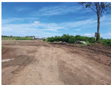
เส้นทางขนส่งแร่ของโครงการ