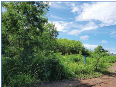
แนวต้นไม้บริเวณโครงการ