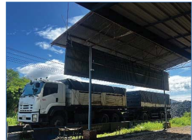
การปิดคลุมผ้าใบรถบรรทุก