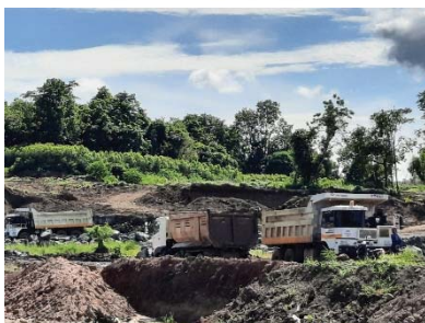
หน้าเหมืองของโครงการ