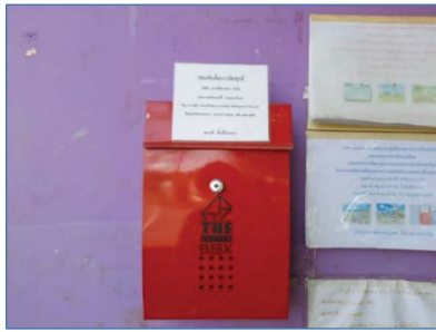
กล่องรับเรื่องราวร้องทุกข์