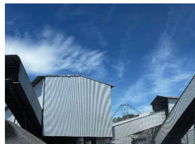
โรงโม่หินของโครงการ