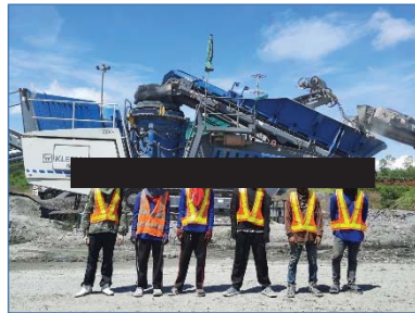
อุปกรณ์ป้องกันอันตราย