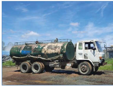
รถฉีดพรมน้ำ