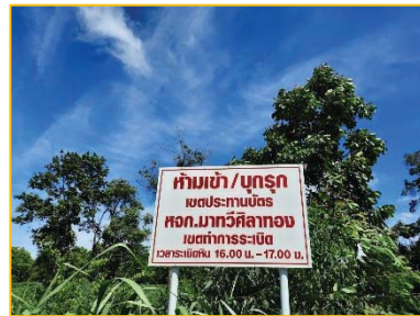
ป้ายเขตอันตรายและเวลาในการระเบิด