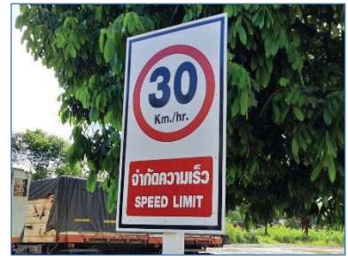
ป้ายจำกัดความเร็วรถบรรทุก